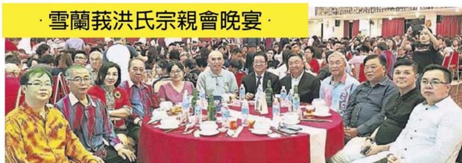
雪蘭莪洪氏宗親會晚宴