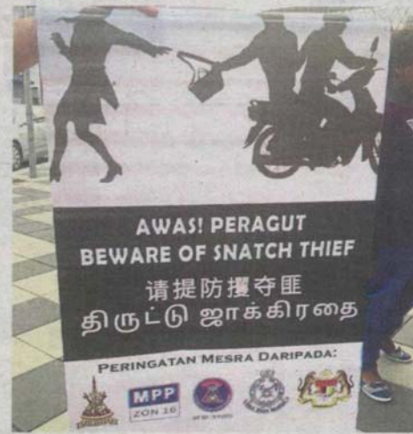
The banner warns people to beware of snatch thieves in Petaling Jaya Old Town.

"We have managed to reduce the number of snatch theft cases in the past six years with the setting up of a police beat and frequent patrols," said Tan, adding that people should remain vigilant. — By JEGATHISWARY SUNDAM