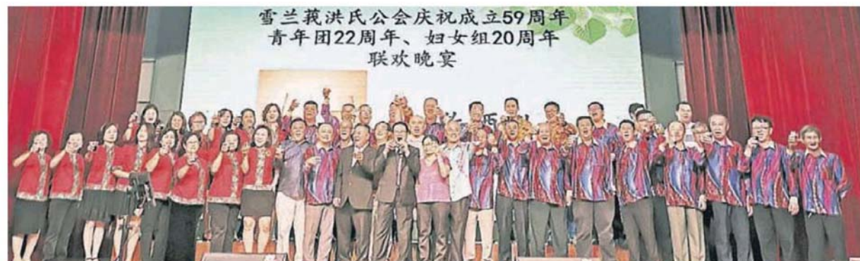
雪蘭莪洪氏公會慶祝成立59周年 青年團22周年、婦女組20周年 聯歡晚宴

他說，雖然在2014年他接任會長職時，公會發生內部人事糾紛，破壞公會名譽，但理事們秉持先賢創會宗旨，敦睦宗誼，家和萬事興的精神，經過調解，終於圓滿解決，大家團結一致，繼續把會務推向高峰。