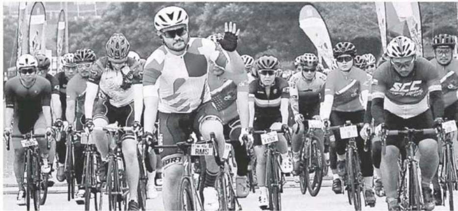
TURUT SERTA: Tengku Amir Shah (tengah) berkenan menyertai Pertandingan Berbasikal Shah Alam International Enduride 2019 anjuran Majlis Bandaraya Shah Alam (MBSA) di Seksyen AEON Big Bukit Rimau, Kota Kemuning Shah Alam, dekat Shah Alam, semalam.