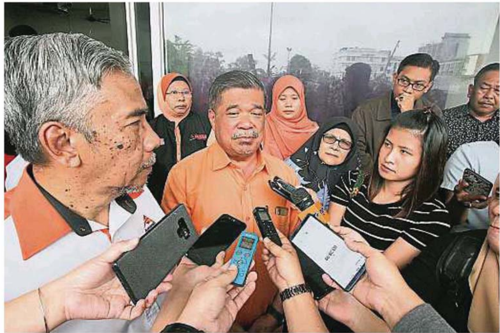
▲誠信黨主席莫哈末沙布：將在砂各地宣傳，向人民解釋誠信黨可為砂拉越帶來發展。

(古晉18日訊) 誠信黨主席莫哈末沙布莫哈末沙布說，過去行動黨被標籤為華人主義政黨，若執政將對巫裔不利，因此极少数馬來選民會支持行動黨。