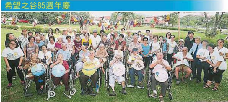
双溪毛糯麻疯病院院民开心高举灯笼，提早欢庆中秋节。

Provided for client's internal research purposes only. May not be further copied, distributed, sold or published in any form without the prior consent of the copyright owner.