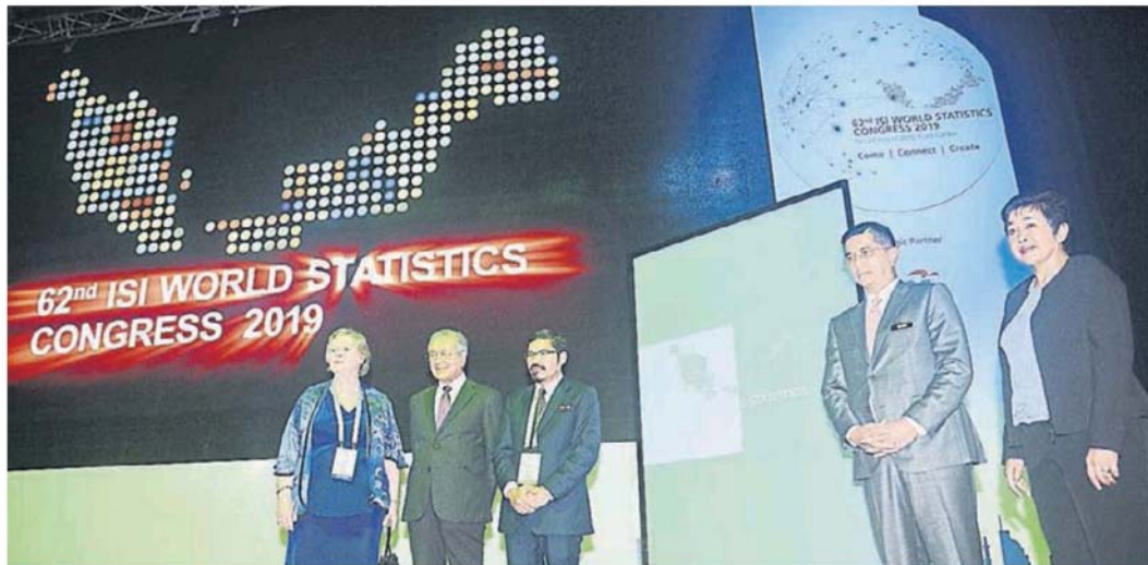
哈末乌兹尔、阿兹敏阿里和诺珊西亚。 马哈迪（左2）为世界统计大会开幕：左起为海伦、莫

（吉隆坡18日讯）首相敦马哈迪说，政府致力在未来落实17项永续发展目标（SDGs），让我国能更全面打击赤贫、不平等对待和气候变化课题。