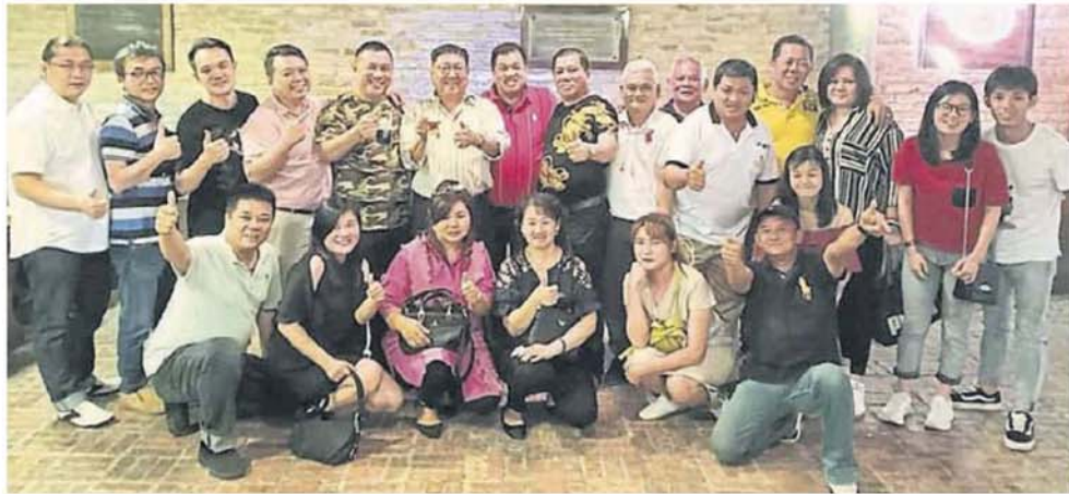
的福品投票。 理事们希望各界善心人士踊跃参与晚宴